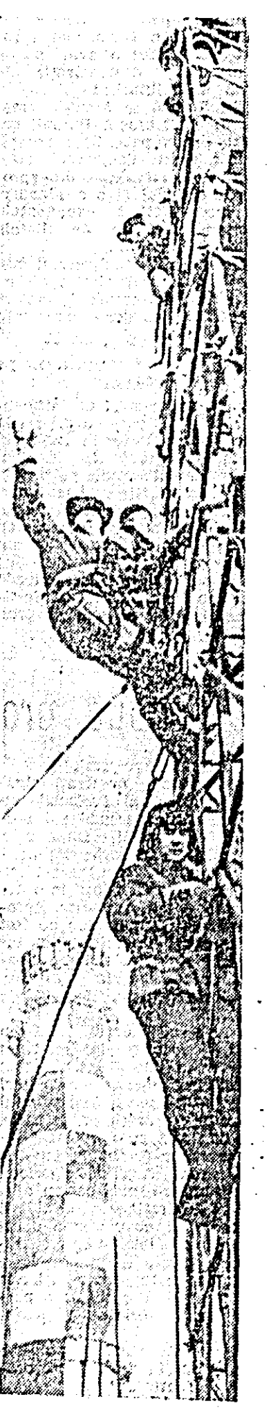
IN FOTO: brigada lui Mihail Ciugunov, fotografată la o înălțime de 60 m, construind coșul unei termocentrale în stepa Kazahstanului.