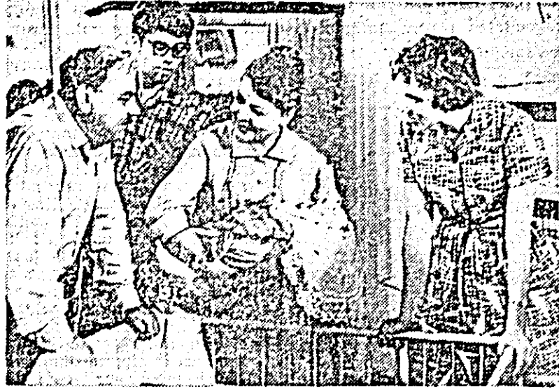
IN CLISEU: o secvență din filmul „Casa surprizelor”.