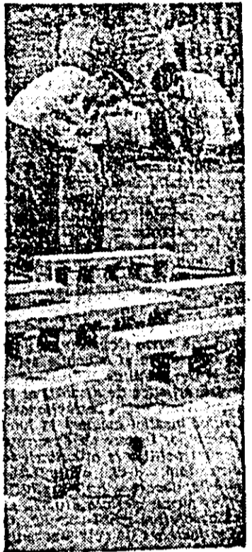
În turnătoria întreprinderii de vagoane întrecerea socialistă se materializează în numeroase lapte de vrednicie. În multe realizări. În fotografii: cu multă grijă pentru calitate sînt pregătite forțele necesare turnării unei noi șarje.