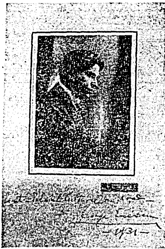
Fotografie dăruită de George Enescu Palatului cultural din Arad în anul 1935