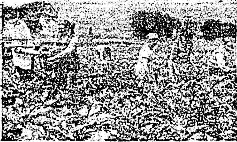
Zilnic din grădina cooperativei agricole „Avântul” din Pecica se recoltează o mare cantitate de legume.