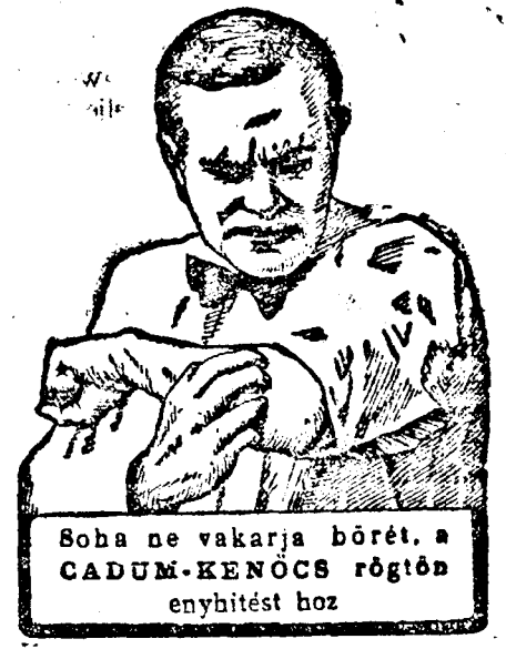
Böha ne vakarja bőrét. a CADUM-KENŐCS rögtön enyhítést hoz