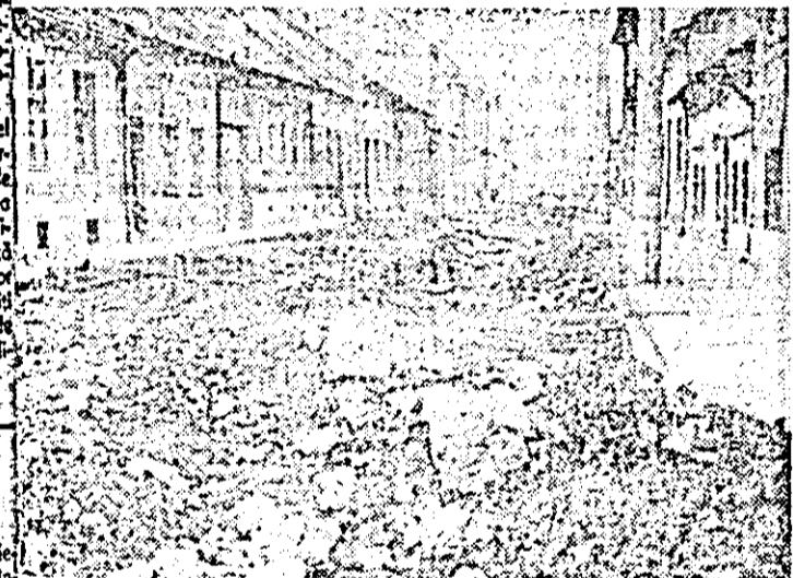
Așa arată str. Narciselor...

transport în comun, economice, lunar, tone de car... dar... interven rezervele mai sus... zate la acei 10 pe care îl acordat fără rețineri: cu a fost refăcută, traseul... el a fost acoperit doar cu... fără asfalt sau piatră, de... creșterea, sursă de împră... norolului pe străzile din