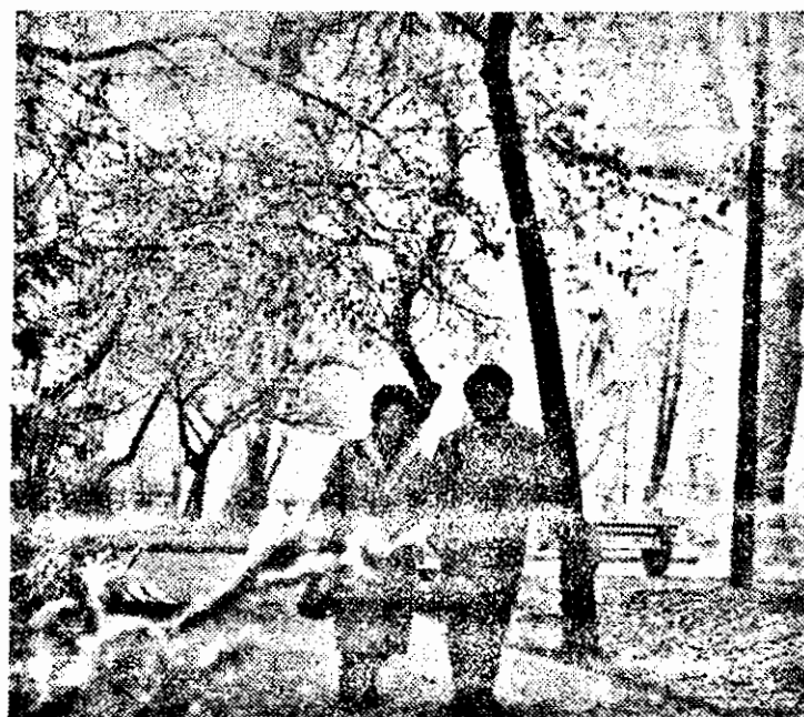
Poezie, în decor de iarnă.