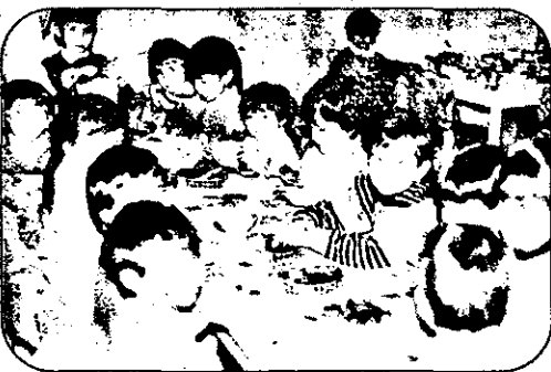
Jocul, etapă a învățării la grupa mijlocie (Grădinița nr. 6 – Arad).