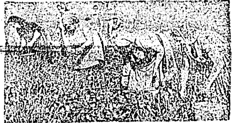
La cooperativa agricolă de producție din Horia se lucrează intens la recoltatul ardelor.