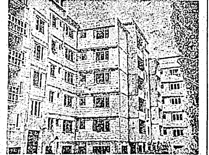
Unul dintre blocurile de locuințe din Calea Aurel Vlaicu, care în curînd își va primi locatarii.