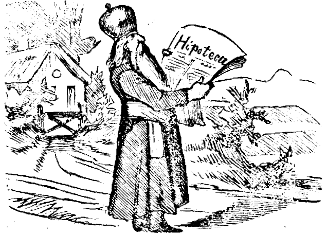
Banchirulu natiunii are hartie cu ipoteca.