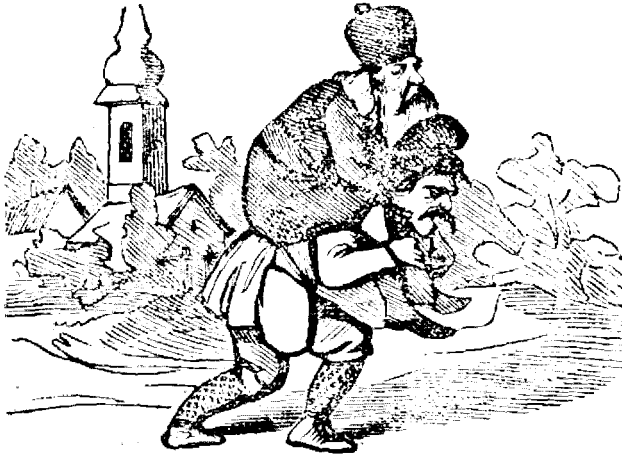
1. Bietulu romanu din Bucovin'a are pe Pe-chentiucu in spate.