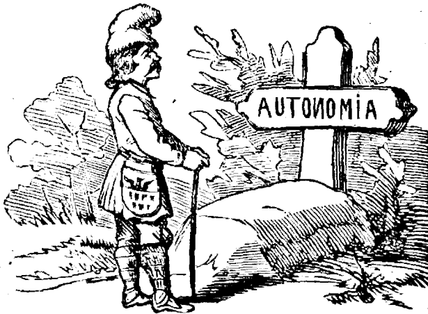
Fratele Ioanu are numai atât'a.