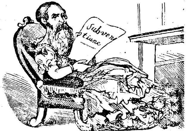
Cocón'a Discordia se bucura de ast'a.