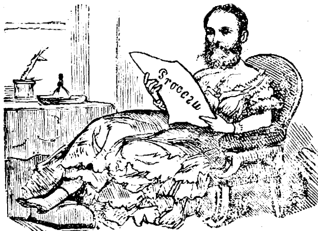
Cocón'a Federatiune are hartia de ast'a.