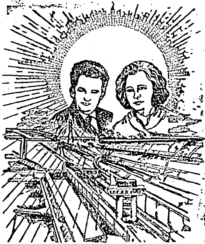
Desen de Lucian Cociuba.

lizările obținute pînă acum, cele pe care ne-am propus să le obținem au fost și sînt posibile datorită minunatelor condiții de desfășurare a activității noastre ce ne-au fost create în anii trecuți de la Congresul al IX-lea al partidului, condiții ce stimulează și fertilizează gîndirea tehnică originală. Iată de ce acum, cînd omagiem ziua de naștere a tovarășei Elena Ceaușescu, eminent militant politic, prestigios om de știință și savant de renume mondial, noi, toți oamenii muncii de la C.C.S.I.T.V.A. îi adresăm, din adîncul inimilor noastre, cele mai calde mulțumiri pentru strălucita activitate desfășurată în folosul științei și tehnologiei românești, urarea străbună de „La mulți ani!”