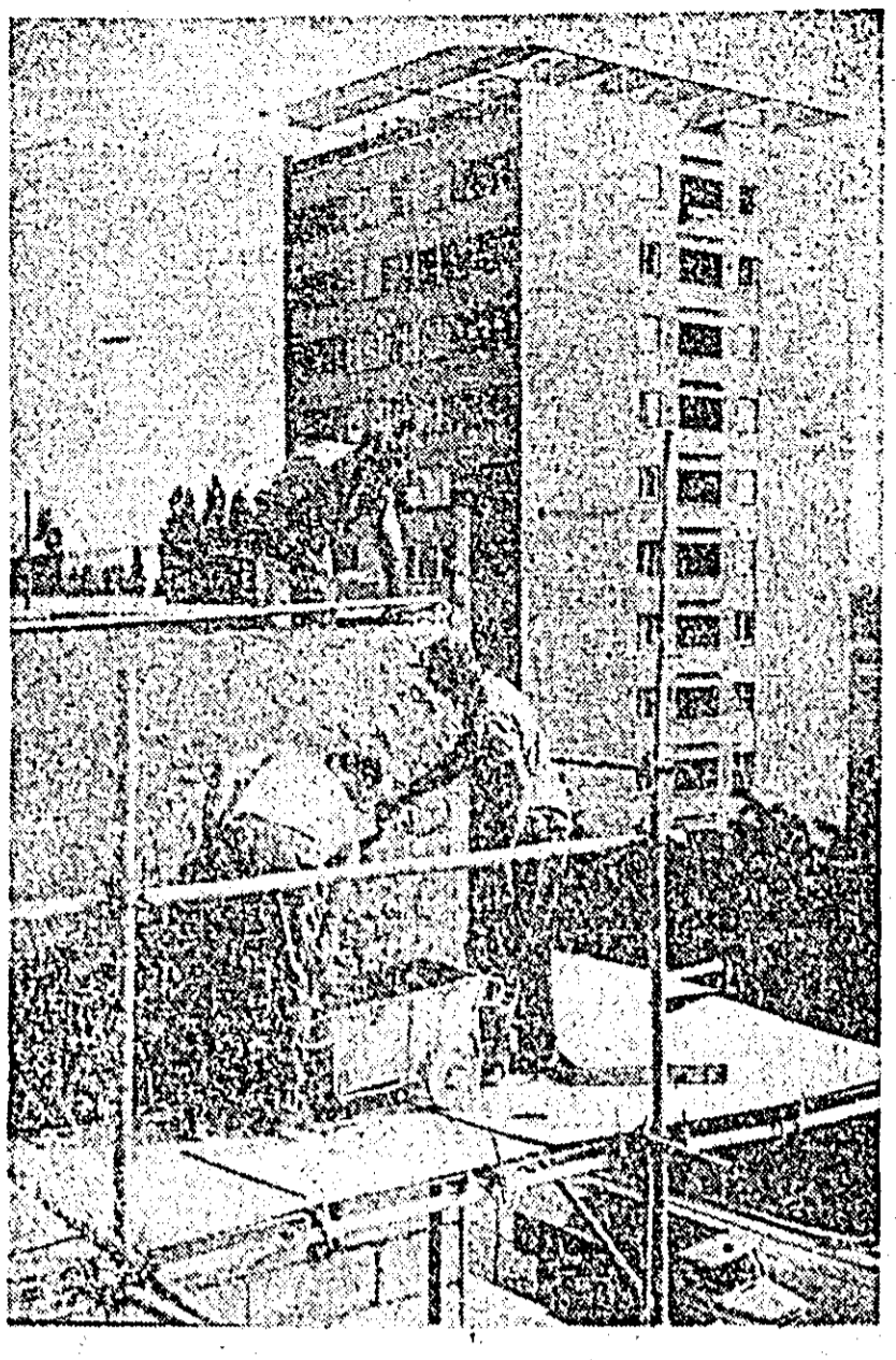
În curînd, un nou bloc de locuințe va fi dat în folosință pe Calea Romanilor.