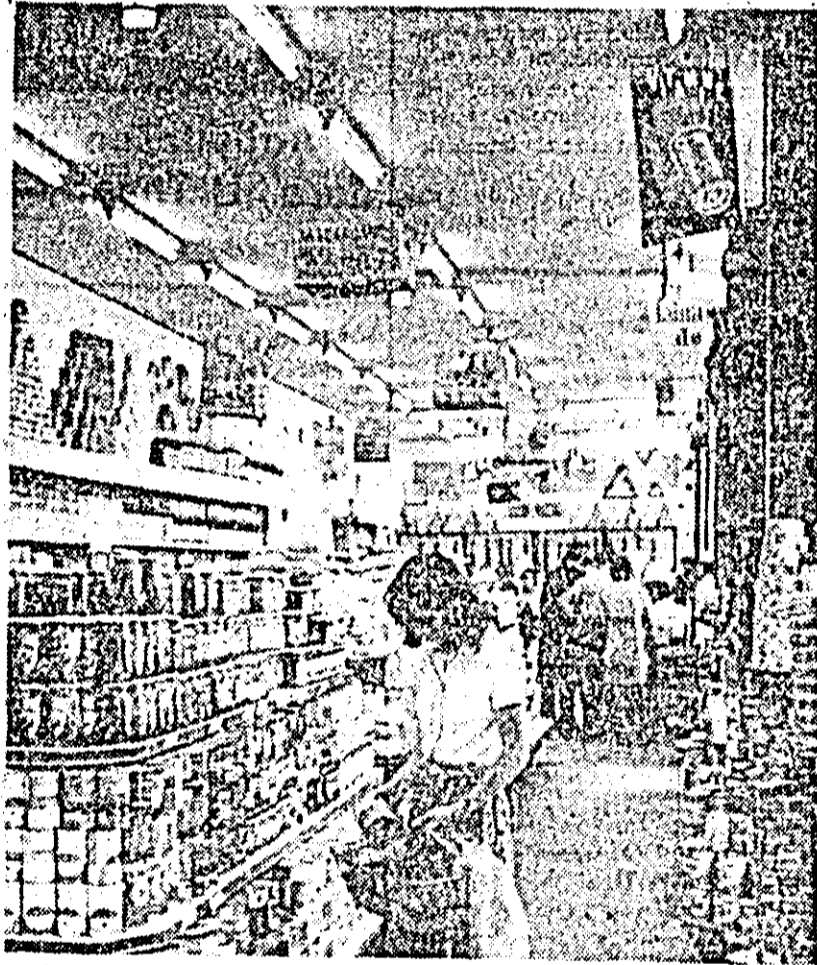
Mijloc modern și rapid de aprovizionare: magazinul cu autoservire „Albina” din Arad.

AFLĂM din partea Centrului meteorologic din localitate ca pentru zilele de 10, 11 și 12 august vremea va fi relativ caldă și cu cerul variabil. Averse de ploaie izolate însoțite de manifestări electrice se vor semnala în special în zona de munte. Vîntul va sufla slab pînă la potrivit. Temperaturile minime din cursul nopții vor fi cuprinse între 18 și 22 de grade, iar maximele din cursul zilei vor oscila între 24 și 26 grade.