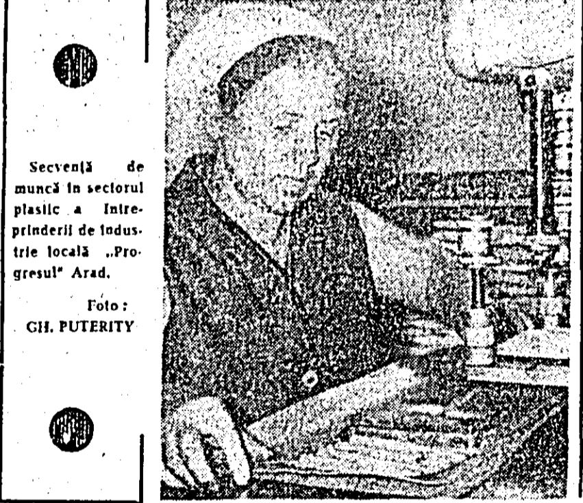
Secvență de muncă în sectorul plastic a Întreprinderii de industrie locală „Progresul“ Arad.