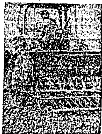
Pe ogoarele cooperativelor agricole din județul nostru semănatul grîului este în toi.

ria și Gurahont. Avîndu-se în vedere că anul acesta perioada de vegetație a întîrziat mult și că în cursul lunii octombrie procesul de coacere s-a accentuat, este necesar ca aceste lucrări să se acorde, în continuare, întreaga atenție. Fiecare parcelă să fie zilnic verificată și acolo unde procentul de umiditate permite, să se treacă la recoltat cu toate forțele. Este important să se organizeze temeinic și transportul, astfel ca porumbul adunat să fie pus în aceeași zi la adăpost. De asemenea, este necesar să se acorde prioritate recoltării porumbului pe acele parcele unde urmează să se însămînteze grîul, trecîndu-se imediat la eliberarea și pregătirea terenului.