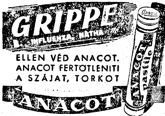
A Dr. WANDER S. A. üzemek készítménye

— Mindezeket a kérdéseket, illetve kéréseket részletes indokollással emlékiratban is a miniszterelnök úr elé terjesztem és bízom abban, hogy ezek a kérdések rövidesen kielégítő megoldást nyernek. Külön és nyomatékosan kérem még azt is, hogy a jövőben Aradról semminemű közintézményt sem költöztessenek el.