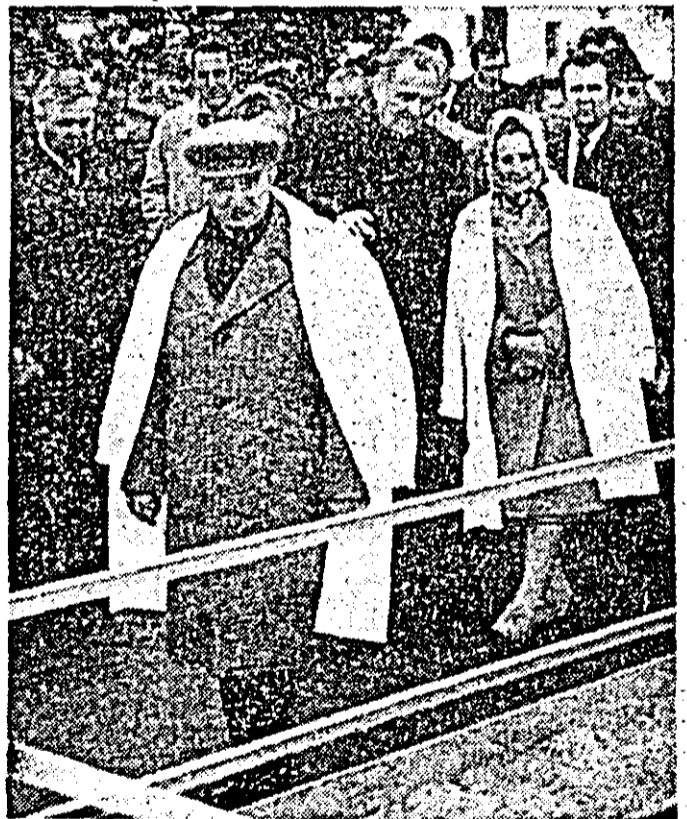
Clipe ce vor rămîne pentru totdeauna în memoria peccanilor: tovarășul Nicolae Ceaușescu vizitează unități agricole din localitate.