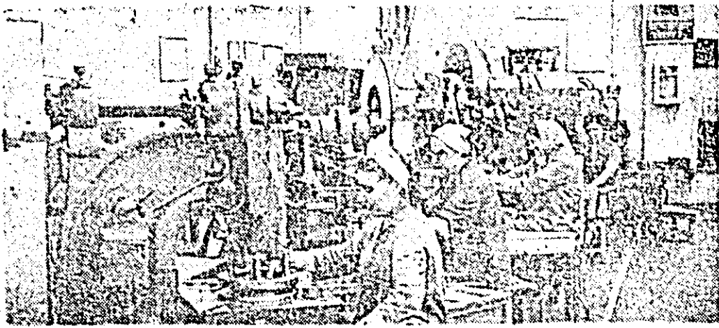
La frumoasele realizări pe care le obține fabrica de ceasornice „Victoria”, colecțivul atelierului de presă aduce o contribuție însemnată. În fotografie: aspect cotidian de muncă în atelier.