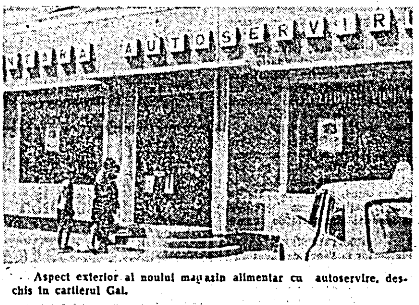
Aspect exterior al noului magazin alimentar cu autoservire, deschis în cartierul Gal.

Pentru 16 octombrie: Vremea va fi relativ călduroasă și instabilă cu cerul mai mult noros. Se vor semnala ploți locale și averse de ploaie. Vântul va sufla moderat cu unele intensificări din sectorul vestic. Temperaturile vor fi cuprinse între 8 și 14 grade noaptea și între 18 și 23 grade ziua. Pentru 17 și 18 octombrie: Vremea se menține în continuare călduroasă. Se vor semnala precipitații sub formă de ploaie și averse de ploaie.