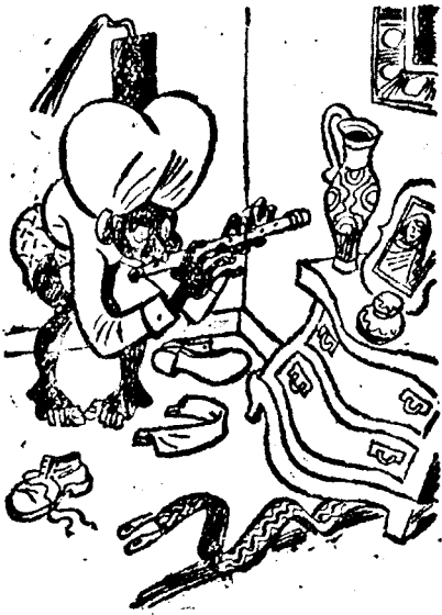
összegyűjti szerteszórt ruhadarabjait.