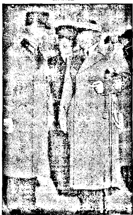
Ungarns Kriegsminister in Rom.

Der ungarische Kriegsminister General Roeder stattete gestern seinen Besuch in der italienischen Hauptstadt ab und wurde bei dieser Gelegenheit auch von dem Duce empfangen. Unser Bild zeigt General Roeder im Gespräch mit General Alberto Pariani nach der Ankunft in Rom.