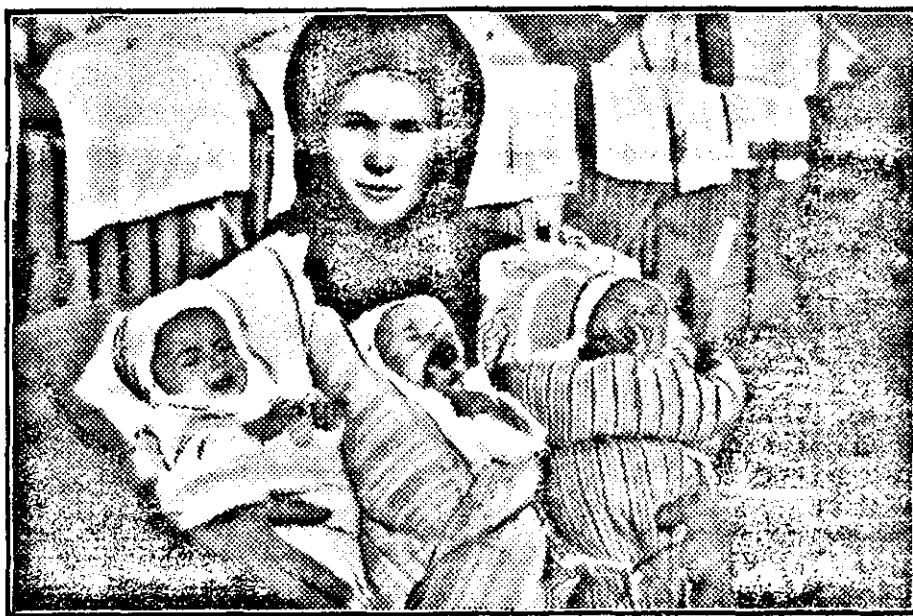
Die schwäbische Mutter mit ihren Drillingen.

Schlägerei entfachte. Die Einrichtung des Kaffeehauses wurde vollkommen zerstört. Zuerst wurde das Bedienungspersonal des Kaffeehauses niedergeschlagen und dann kamen die Gäste an die Reihe, welche den Angegriffenen zu Hilfe eilen wollten. Der Inhaber des Lokals und mehrere seiner Angestellten sind schwer verletzt, der Stellner Leon mußte in sterbendem Zustande in ein Spital überführt werden. Die Polizei nimmt an, daß es sich um einen politischen Racheakt handelt, doch konnten die Angreifer noch nicht festgenommen werden.