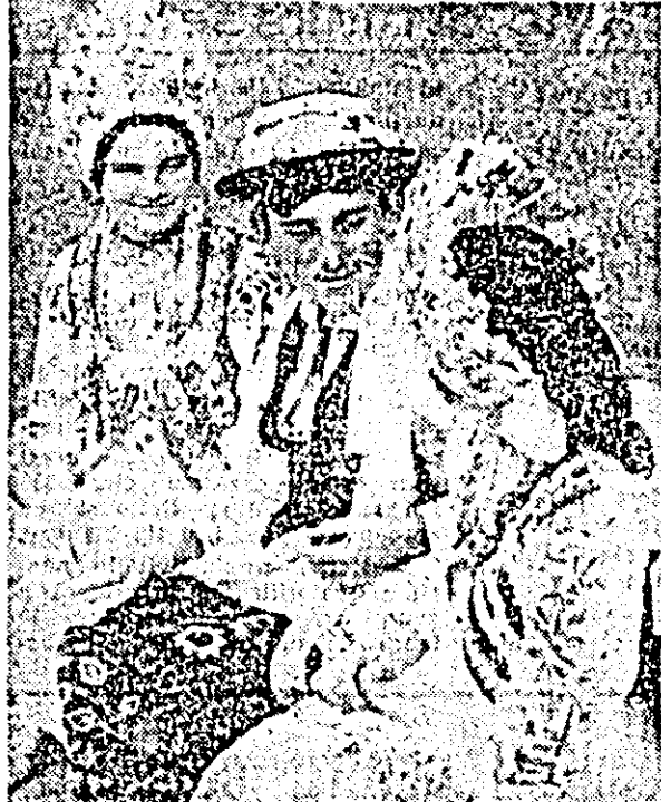
Frumusețea și valoarea portului popular de pe Valea Crișului Alb este o certitudine veche. O dovedește și imaginea de mai sus ce ne înălțăsează portul popular din Chereșuș.

Între 29 și 30 octombrie a.c., sub egida Comitetului județean de cultură și educație socialistă Societății de științe filologice, Inspectoratului școlar județean și Casei corpului didactic din Arad, căminul cultural și liceul agroindustrial din Gurahont găzduiesc un simpozion și o sesiune de comunicări științifice pe tema: „Folclorul românesc — nesecat izvor al creației literare”. Își dau concursul cadre didactice universitare din Cluj-Napoca și Timișoara, profesori din Arad și Gurahont, redactorii al editurilor „Tribuna” redactorii al editurilor „Minerva” din București și „Dacia” din Cluj-Napoca, poeți clujeni și membri ai cenaclului „Porțile Zărandului” din Gurahont. Grupul folcloric al căminului cultural din Gurahont va prezenta, cu acest prilej, obiceiuri din Țara Zărandului.