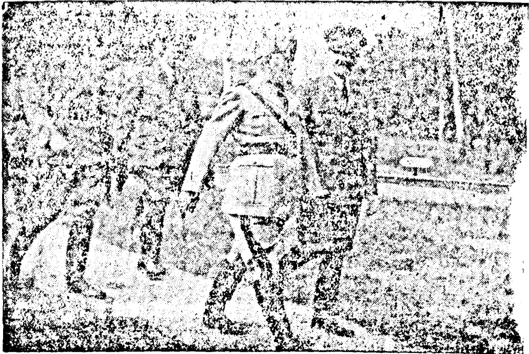
Führerul și Ducele pe frontul bolșevic.

Reprezentațiile încep la orele 3, 5, 7 și 9 Duminică și sârb. matineu la orele 11 a. m.