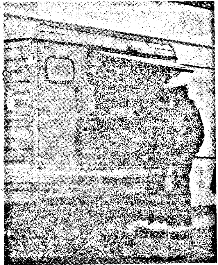
Privatizarea: la înălțime!