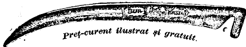
Preț-curent ilustrat și gratuit.

Coasa de oțel „Bur“ numai atunci este veritabilă, dacă pe mâner poartă gravată inscripția aceasta: W. G. Kőbánya , iar pe atul ei este tipărită marca firmei cum arată figura asta: 1906—20