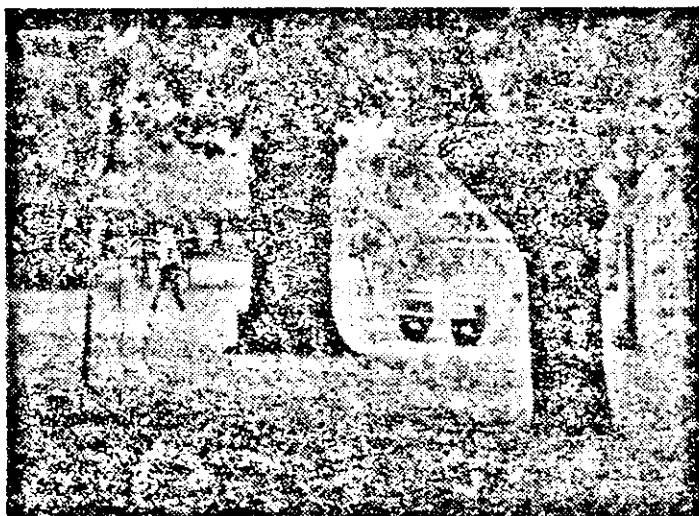
E toamnă iar...