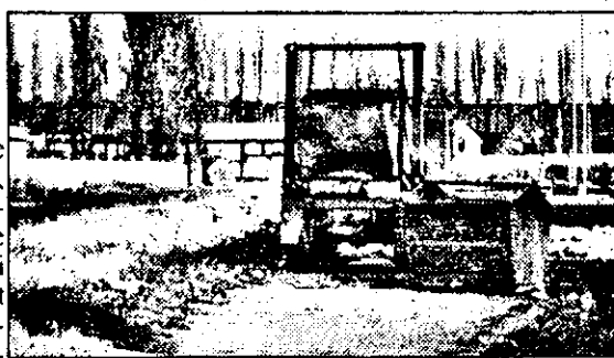
Din cauza apei și a buruienilor de pe strada Banu Mărăcine, containerele de gunoi sunt amplasate direct pe... trotuar!