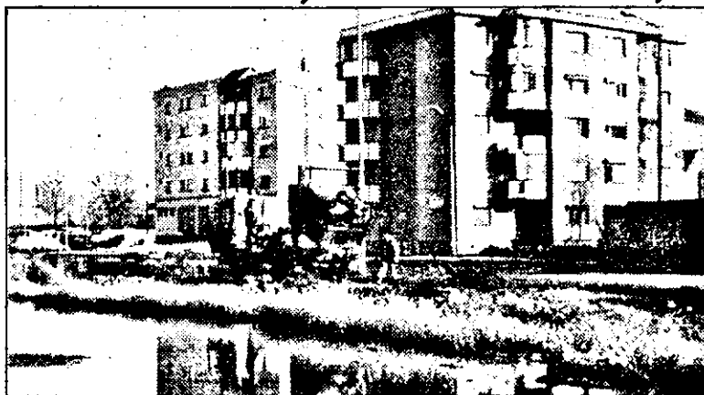
Peisaj „lacustru”, cu blocuri, bălării și containere pe trotuar, în fața stadionului RAPID - C.F.R....

● Boscheți, băltoace și... containere pe trotuar