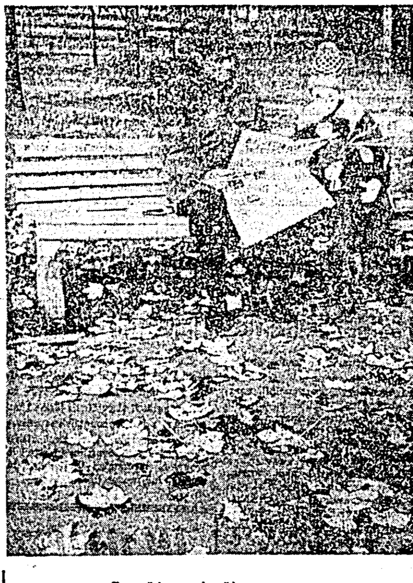
Toamnă în parcul arădean.

3-1. Arbitrii M. Bogorlu din Sibiu și V. Moraru din Cluj au condus echipele: FORESTA: Iluță, Ștefan, Copaci, Streza, Nădăban, Dors. MEDICINA: Suru, Stancu, Ercuța, Nagy, Gîrleanu, Jula. Au mai jucat Vekeș la gazde și Cercei și Clonea la oaspeți. Echipa feminină Constructorul Arad continuă să joace un rol secundar în divizion B, nereușind încă nici o victorie în actualul campionat. Jucînd pe teren propriu, arădencele au fost întrecute cu 3-0 (7-15, 6-15, 10-15) de echipa Corvinul din Deva.