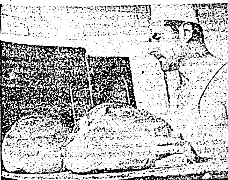
O nouă sarcină din gustoasa plină de Pecica.

Interesul și preocuparea pentru cel mai bun gospodărie a combustibilului trebuie să constituie pentru fiecare conducător al SMA, pentru fiecare mecanoziar, un act cotidian de vigoare și conștiință cetățenească.