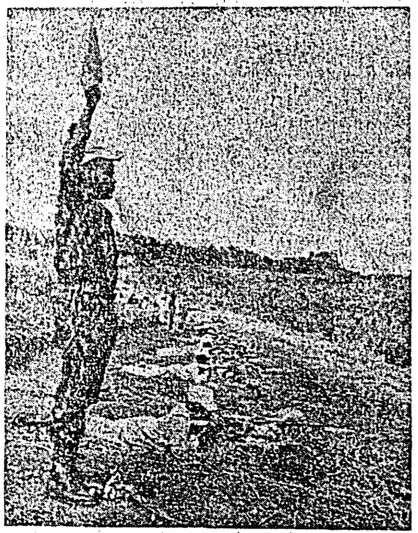
RHODESIA. Aspect din timpul antrenamentelor de luptă ale forțelor de gherilă din cadrul forțelor naționale de eliberare Zimbabwe împotriva regimului rasist rhodesian.

MOSCOVA 13 (Agerpres). — Agenția TASS relatează că zborul stațiilor automate Interplaneta Sovietice „Marte-4”, „Marte-5”, „Marte-6”, și „Marte-7”, lansate în Uniunea Sovietică în lunile iulie-august, continuă. Cele patru stații se află în prezent la o distanță de aproximativ 50 milioane km de Pământ. Potrivit programului, în timpul zborului continuă cercetările științifice privitoare la caracteristicile fizice ale spațiului interplanetar. Printre altele, sint urmărite caracteristicile plasmei solare și ale razelor cosmice. În timpul zborului a fost corectată traiectoria tuturor celor patru stații. În compartimentele destinate aparatelor științifice se mențin presiuni și temperaturi normale. Centrul de coordonare și calcul, precum și institutele de specialitate ale Academiei de Științe a URSS prelucrează informațiile care se obțin de la bordul stațiilor automate „Marte”.