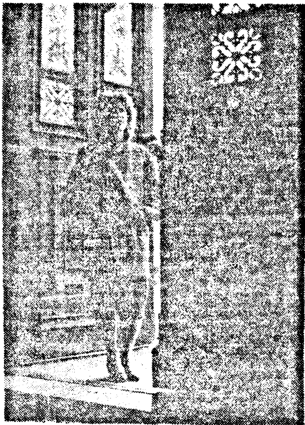
O RAZĂ DE LUMINĂ