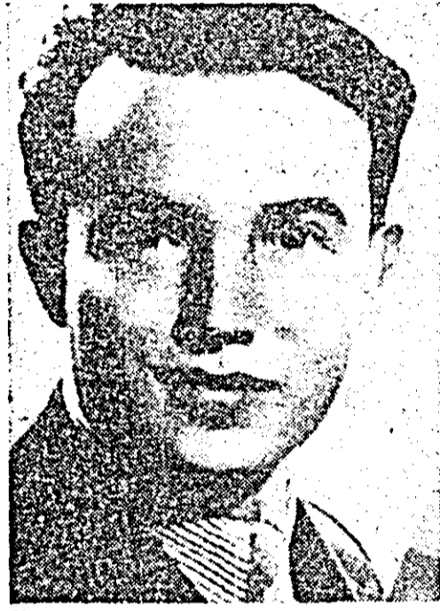
Mihai Beniuc în 1940 la Cluj.

m-am întors în satul meu din motive de boală. Știam că nu voi mai putea urmări publicațiile literare. Dar se anunțaseră „Biletetele de Papagal” ale lui Arghezi și m-am abonat de la început, bucurîndu-mă nespus că revista îmi venea zilnic de la București, tocmai la Sebiș. Erau în paginile ei nume consacrate ca: Topl-