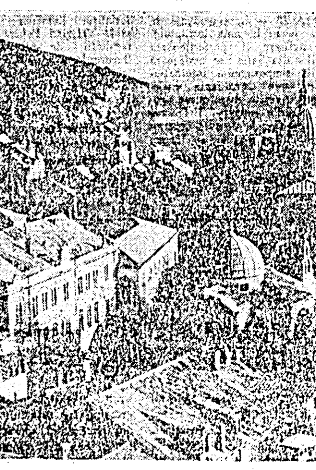
R. S. F. IUGOSLAVIA. — Vedere parțială a Dubrovnicului.