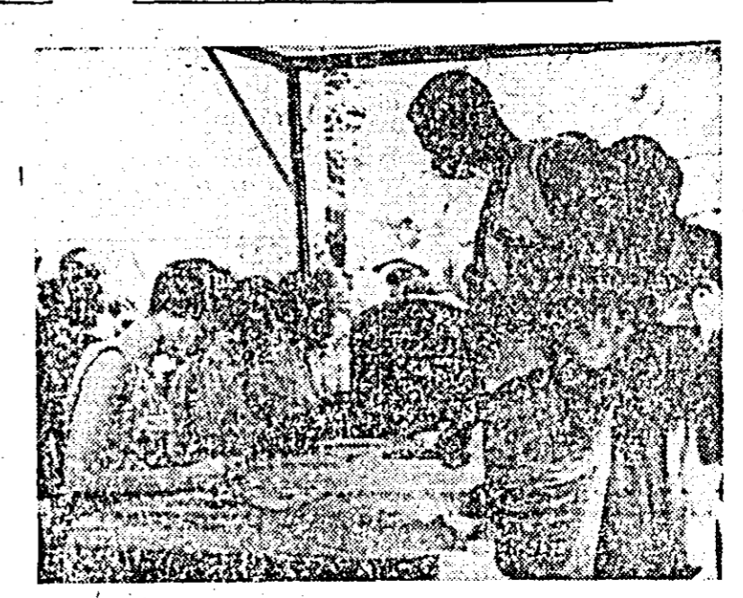
Săuți de foame și mizerie, de oprirea colonialismului portughez, numeroși angolezi se refugiază în țara vecină, Congo. Fotografia de mai sus a fost făcută la Kifentel Congo (Kinshasa) unde un grup de refugiați angolezi primesc sprijin din partea misiunii de ajutorare a refugiaților, unul din organisme sociale ale O.N.U.

În consfățuirii preliminare succesive, cancelariile din țările Americii Latine desfășoară pregătiri intense în vederea reuniunii șefilor de state din emisfera occidentală, programată pentru 12-14 aprilie la Punta del Este (Uruguay).