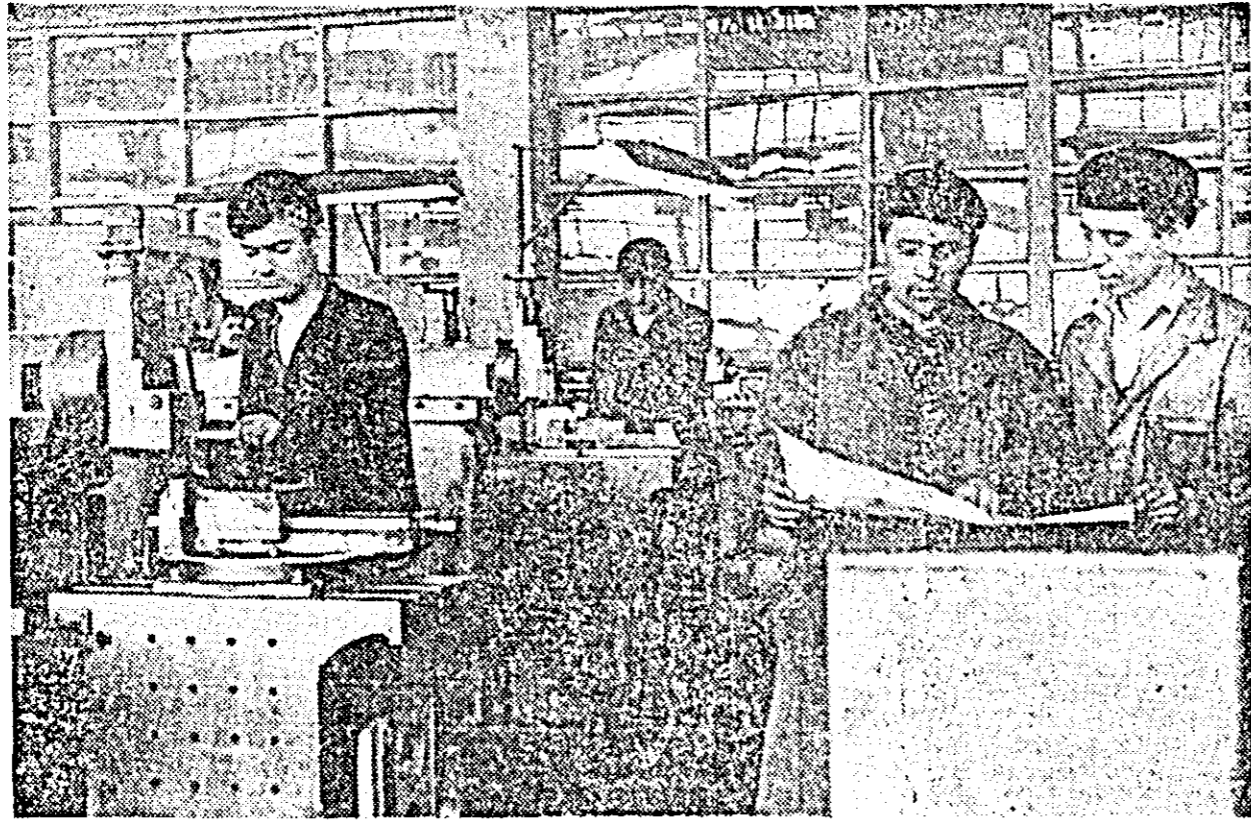
Buna întreținere a utilajului este urmărirea cu grijă de către sectorul mecanic șef al Uzinei de strunguri. În executarea unor lucrări de bună calitate este antrenat fiecare membru al colectivului pentru a se asigura o viață cât mai lungă a mașinilor.

Semnalam zilele trecute faptul că mai există în unele unități terenuri pe care nu s-a întors brazdă nouă. E drept că de atunci mersul arăturilor s-a impulsat dar nu în suficientă măsură. Conducerea cooperativele agricole de producție și specialiștii de la cooperativele agricole din Covășinț, Felnaș, Satu Mare și „Spicul” Vinga nu au făcut totul pentru urgențarea lucrărilor care trebuie de grabă terminate.