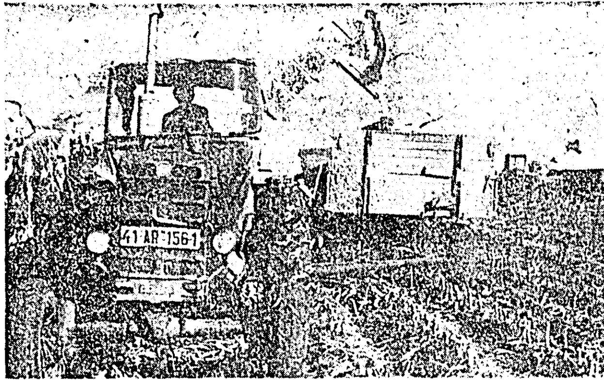
La I.A.S. Nădlac se lucrează intens la eliberatul terenului.