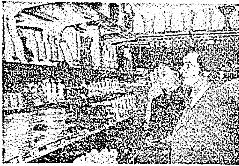
Un magazin arădean, bine aprovizionat, vizitat zilnic de sute de cumpărători — „Porțelanul”.

Comitetul Politic Executiv a examinat și adoptat și alte hotărâri privind activitatea curentă de partid și de stat.