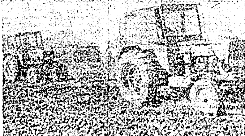
Arături adinci la I.A.S. Nădlac

În cadrul pregătirilor pentru buna iernare a animalelor, în toate unitățile cooperatiste din comuna Sîntana o atenție deosebită s-a acordat asigurării bazelor furajere. Astfel, la cooperativele agricole din Sîntana, Comlăuș și Caporal Alexu s-au înșilozat mari cantități de furaje, depășindu-se peste tot cantitatea planificată — la Sîntana și Caporal Alexu cu mai mult decît dublu, iar la Comlăuș cu peste o mie tone.