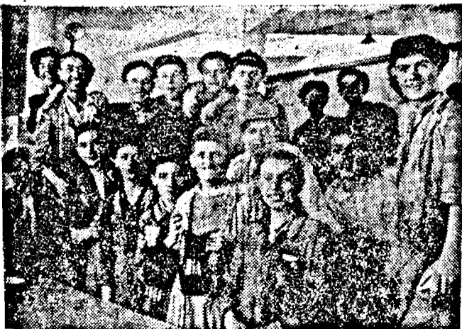
Un grup vesel de muncitori așteptând masa

De aceste gânduri am fost pătrunși, în timp ce priveam grupulețele de muncitori și fiecare se îndrepta spre secția respectivă.