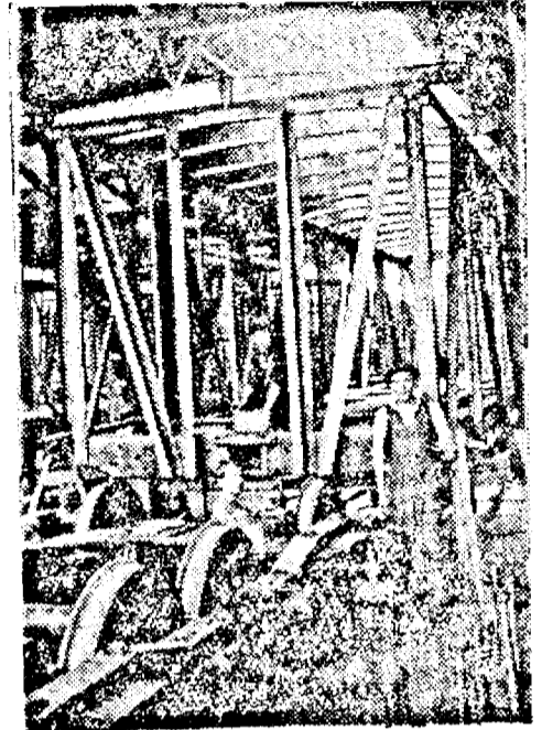
Marirea producției în ateliere

tea, la fabrica Astra s'a terminat un curs de alfabizare, la care au participat 110 elevi, muncitori cu 1, 2 sau 3 clase primare. Toți acești elevi, în cursul lunii trecute au primit diploma de absolvire a clasei 7.