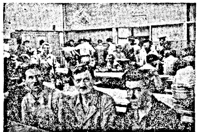
Poftă bună, la masă bună

Muncitorimea arădană, la alegerile sindicale va dovedi că-și înțelege pe deplin menirea ei, în statul român democrat și știe să-și aleagă adevărații conducători.