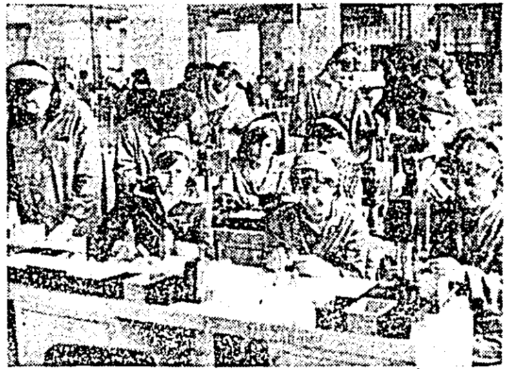
Levi ai Liceului industrial nr. 13 — clase cu profil de mecanică fină — în practică la întreprinderea de orologerie.