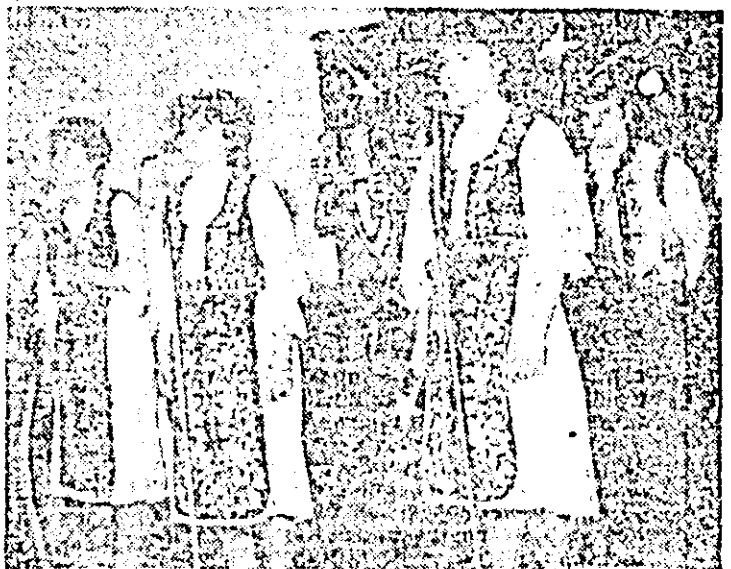
La Revelionul textilistilor o surpriză plăcută: Plugușorul prezentat într-o manieră mai puțin obișnuită de un grup de tinere fete.