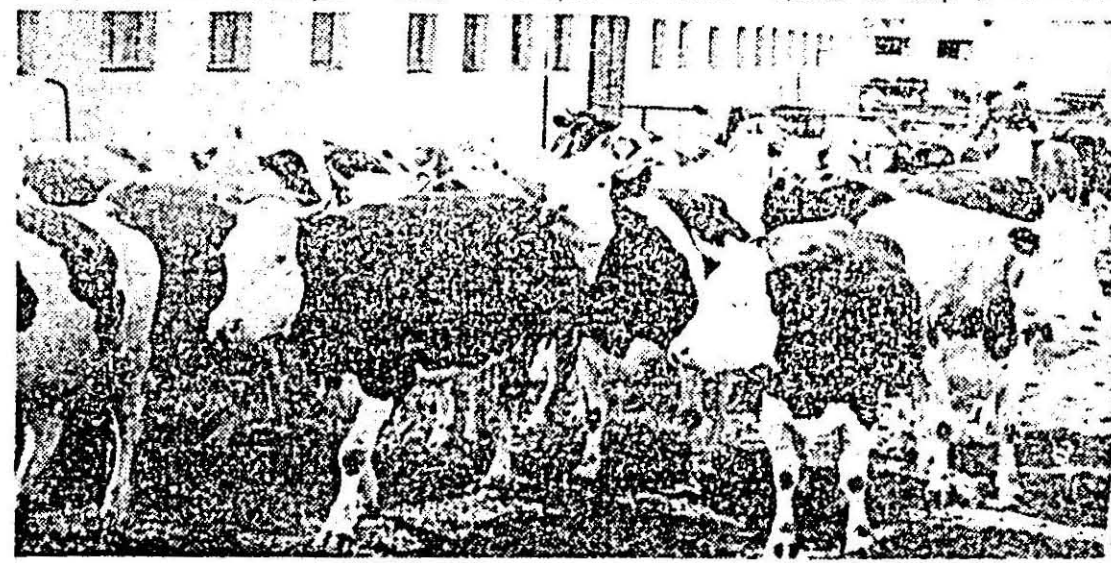
În ferma zootehnică a I.A.S. Barațca, vacile — exemplare deosebit de frumoase, bine întreținute — au fost scoase la aer curat, în padocuri. Cu asemenea exemplare nu este de mirare că această unitate se află printre cele de frunte din județ.

— Ferma dv. dispune de animale cu un fond genetic valoros, de exemplare cu înalt potențial productiv, ceea ce le face să fie căutate și cumpărate de alte unități zootehnice. De exemplu, despre vaca recordmană cu o producție zilnică de 34—36