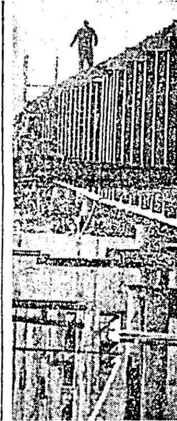
Pe șantierul noului pod ce se construiește peste riul Mureș.