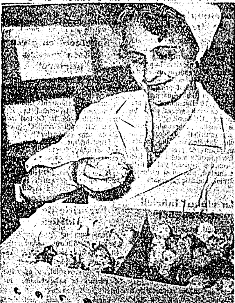
S-au obținut „primele recolte”. Se face controlul pulilor de 21 care vor lua apoi destinația spre gospodăriile colective.

În deschidere la ora 9 se va desfășura partida dintre formațiile arădene ICA II și CFR. ANOTAJ. Pe Mureș se va desfășura mîno tradiționala întrecere de canotaj „Cupa Mureș-Bega”, la care participă sportivi din Timișoara și Arad. Întrecerile încep la ora 10.