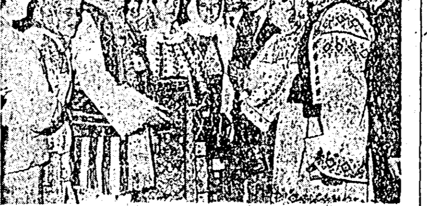
INTR-O PAUZA ÎN TÎMPUL CONGRESULUI

În aplauzele asistenței în numele Congresului, prezidiul mul-