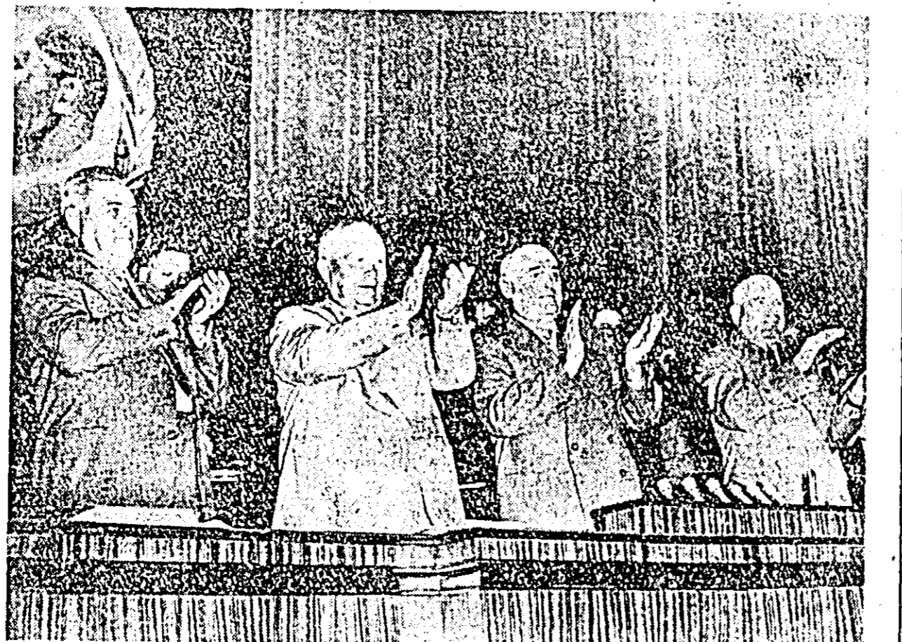
ASPECT DIN PREZIDIUL CONGRESULUI