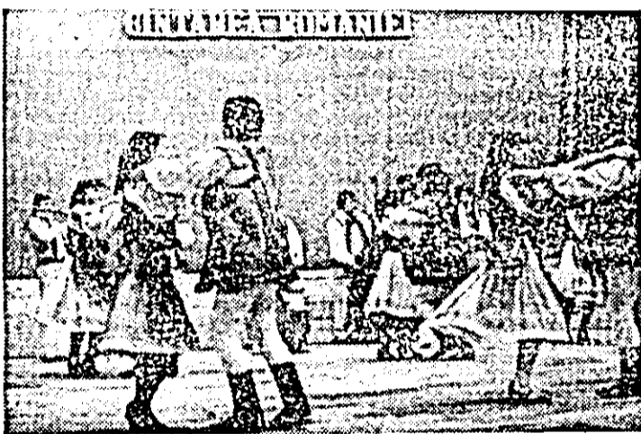
In vârtejul jocului popular.