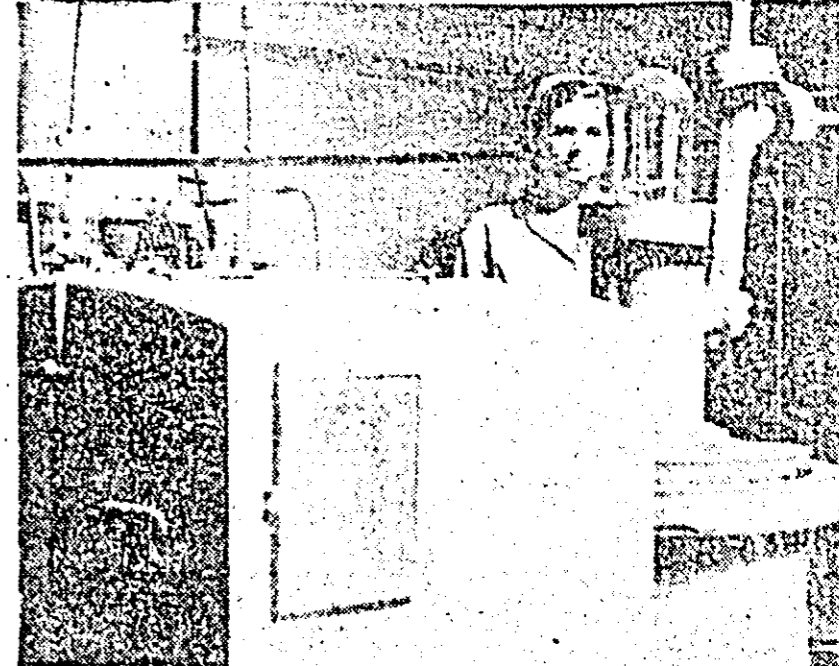
La unitatea „7 Noiembrie” a Combinatului alimentară, calitatea spiritului este controlată cu atenție. Clîșeul alăturat vă prezintă un aspect din timpul probelor executate.