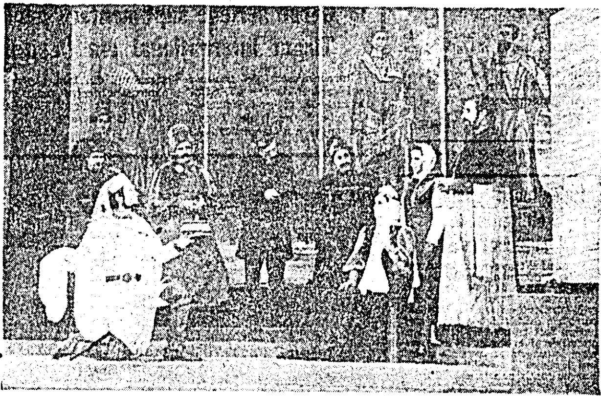
Moment din spectacol.

Scenografia lui Sever Frențiu, aerată și punctată prin câteva fresce sugestive, s-a încorporat organic în viziunea de ansamblu a spectacolului și a alcătuit un spațiu propice desfășurării unei drame despovertate de încălțatura unui retoricism excesiv. STELA GABOR