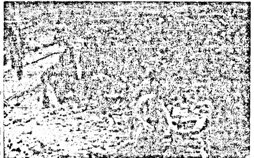
În curtea fabricii Astra cel peste 1700 muncitori, tehnicieni și funcționari fac ordine. Este răspunsul pe care oamenii muncii din Arad îl dau celor care ar voi să întrebe ce înseamnă Congresul Partidului Unic Muncitoresc care va avea loc în curând la Bucu rești, este răspunsul pe care îl dau imperialismului ațâțător la războaie. Așa se face ordine în curtea fabricii, așa se face ordine în rândurile clăditelor muncitoare și așa se face ordine în Republica Populară Română.