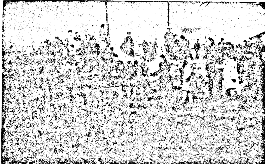
Pe șantierele din fața gării — Piața Tinerețului — sute de tineri UTM-ști, elevi, elevi și militari se străduiesc de zor să ștergă încă o urmă a războiului și să înalțe încă un loc de odihnă și recreație pentru toți cei ce muncesc. Înfrății prin munca lor voluntară ei clădesc țara pe care o vor conduce mâine.

Aspecte de pe șantierele de muncă voluntară