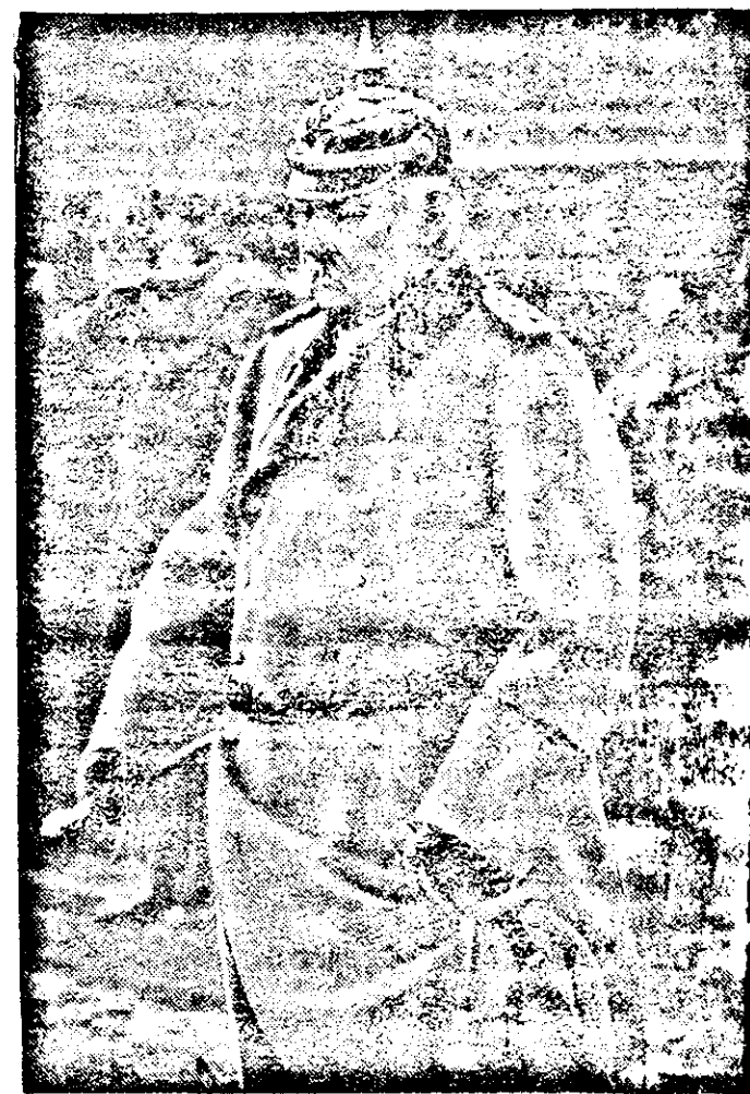
Reichspräsident von Hindenburg feiert heute, am 2. Oktober seinen 86. Geburtstag.

Der Tarif, nach welchem die Hilfslehrer bezahlt werden, wurde wie folgt festgesetzt: 1700 Lei monatlich in den Städten der ersten drei Kategorien, 1500 Lei für die anderen Städte, 1200 Lei für die Dörfer.