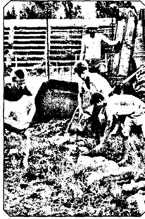
O parte din muncitorii care lucreaza la refacerea gazonului si a pistei de atletism, de la stadionul Astra-CFR.