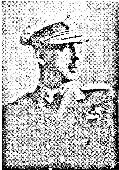
Majestatea Sa Regele Carol al II-lea

și indispensabile în uriașul angrenaj al mașinariilor cari trebuie să ducă România