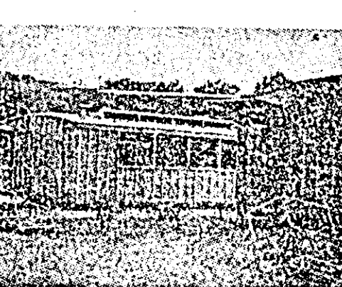
„Clase-vagon” la lătă o realitate crudă a învățămîntului din Franța.

În loc să ia măsuri pentru îmbunătățirea actualului stări de lucruri, autoritățile au luat o serie de măsuri menite să restrîngă numărul școlărilor și să realizeze „economii” de