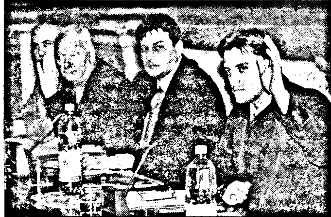
Un vot sobru

Executivul a precizat că este vorba doar despre o Hotărâre a