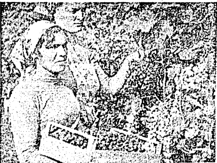
La cules de struguri...

De un real interes pentru studiul culturii și sistemului de construcții în perioada primitivă și cea sclavagistă sînt zidurile, pînă nu de mult acoperite de pămînt, ale unui număr de nouă mări edificii datînd din dinastia Zhou (1100-221 î.e.n.), precum și plăcile din piatră găsite în vechile morminte, pe care sînt gravate denumiri de reșate, ranguri și nume ale unor oficialități din acele timpuri.