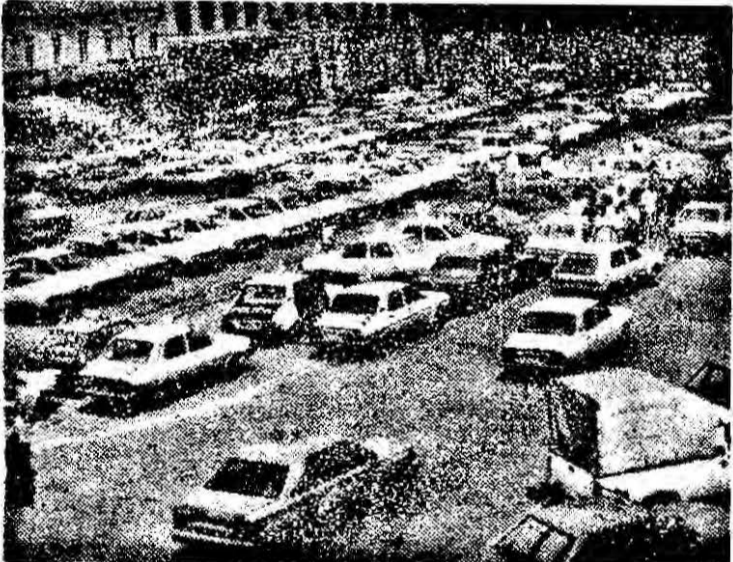
Invasia mașinilor în Arad - „boală” a contemporanei.