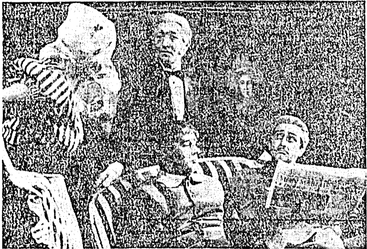
IN CLIȘEU: o scenă din piesa „Călător fără bagaje”.