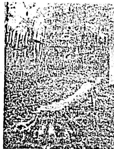
Loc de popas...

Cu acestea numărul mașinilor și al utilajelor agricole înscrise în programul de activitate pe acest an al cunoscutei întreprinderi a ajuns la 20.