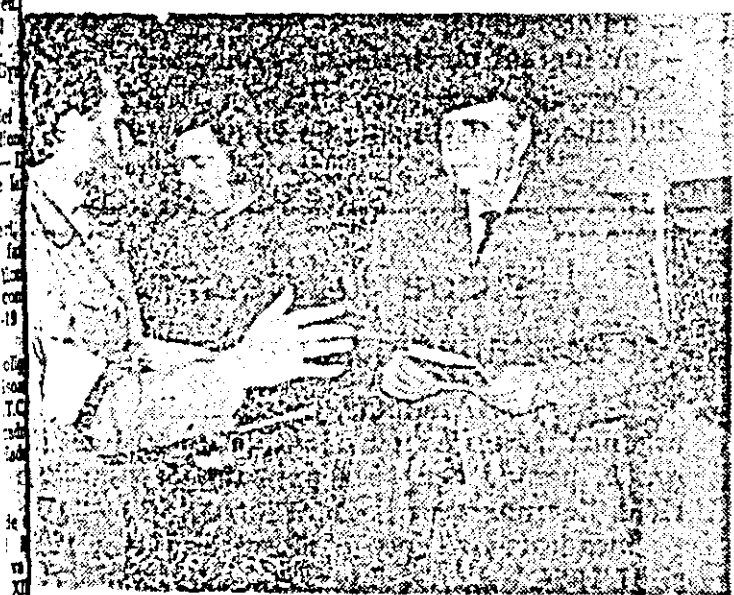
Ion Niță Nicodin, omul care a dus în lume faima picturii naive și culorile adine simțite ale plăturilor din Țara Crișului, discutând cu admiratorii despre măiestria artei sale.