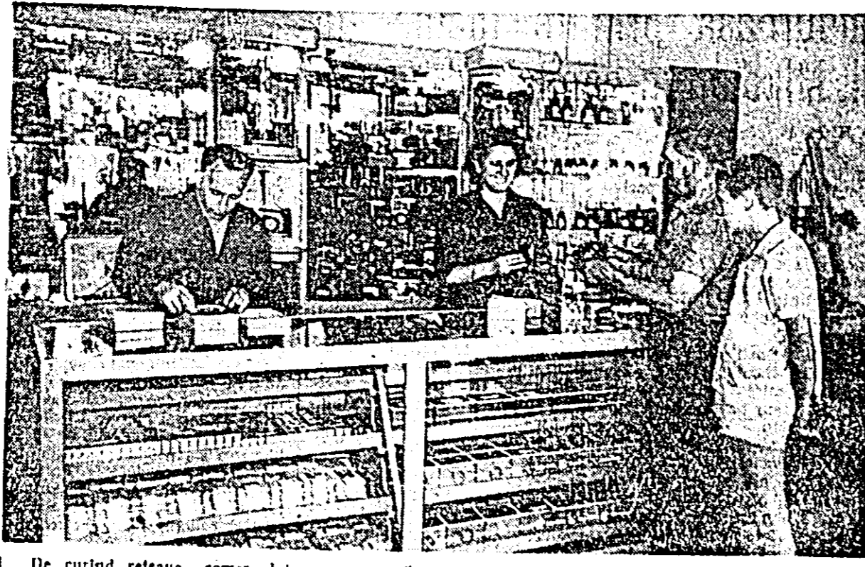
De curând rețeaua comercială din orașul nostru s-a îmbogățit cu o nouă unitate. Astfel, pe bu. Republicii s-a deschis magazinul „Orizont” specializat pentru articole foto...