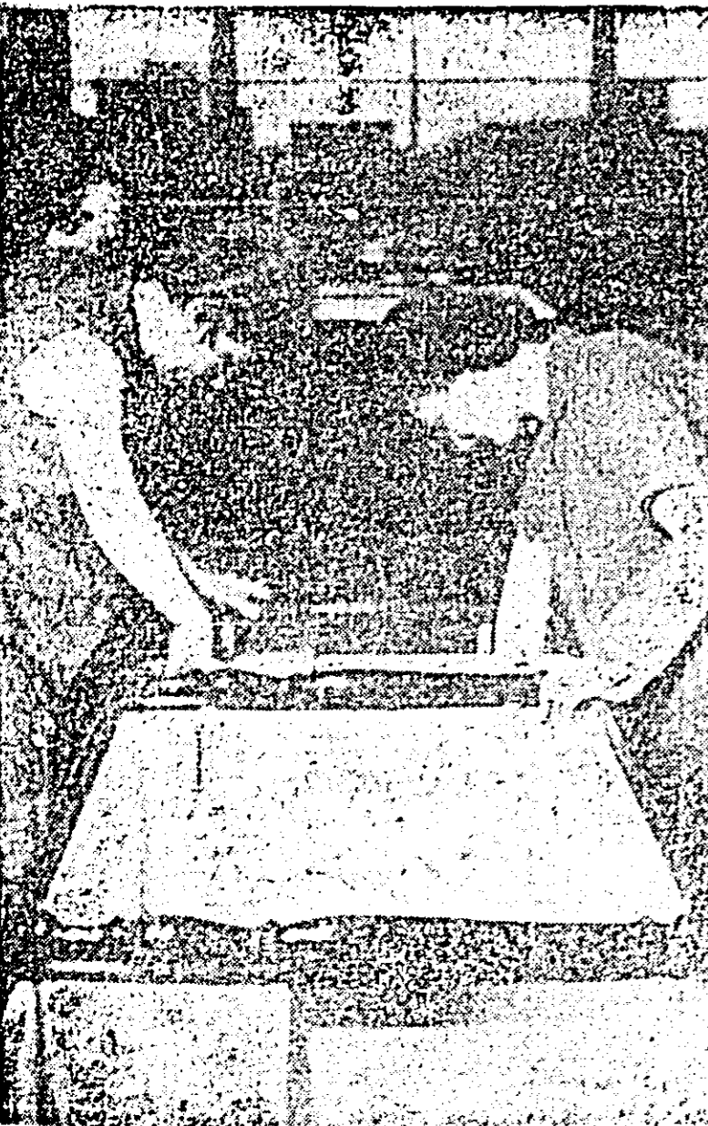
La secția montaj a fabricii de mobilă se lucrează cu însușirea pentru ca angajamentele să devină fapte.