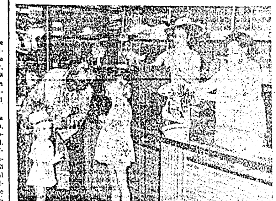
Noul magazin "Hermes" deschis recent la Nădlac oferă un sortiment bogal de mărfuri pentru toate categoriile de cumpărători.