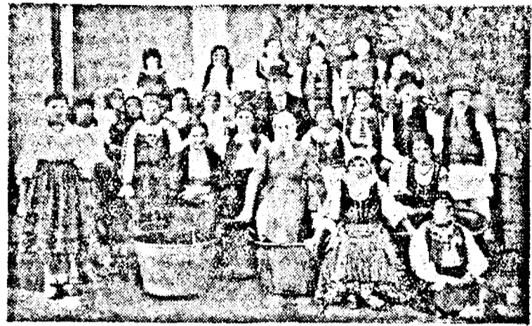
Echipa de lucrătoare a cooperativei pentru fabricarea magiunului din comuna Roșcani

Cunoscător al avantajelor cooperativei, le-a propagat celor interesați și a reușit să le câștige — pe un moment — încrederea și să le deschidă baerile pungi. Dar au intervenit repede critici, oameni cu triste experiențe — și membrii și-au pretins restituirea cotizațiilor. Omul a restituit cinstit toți