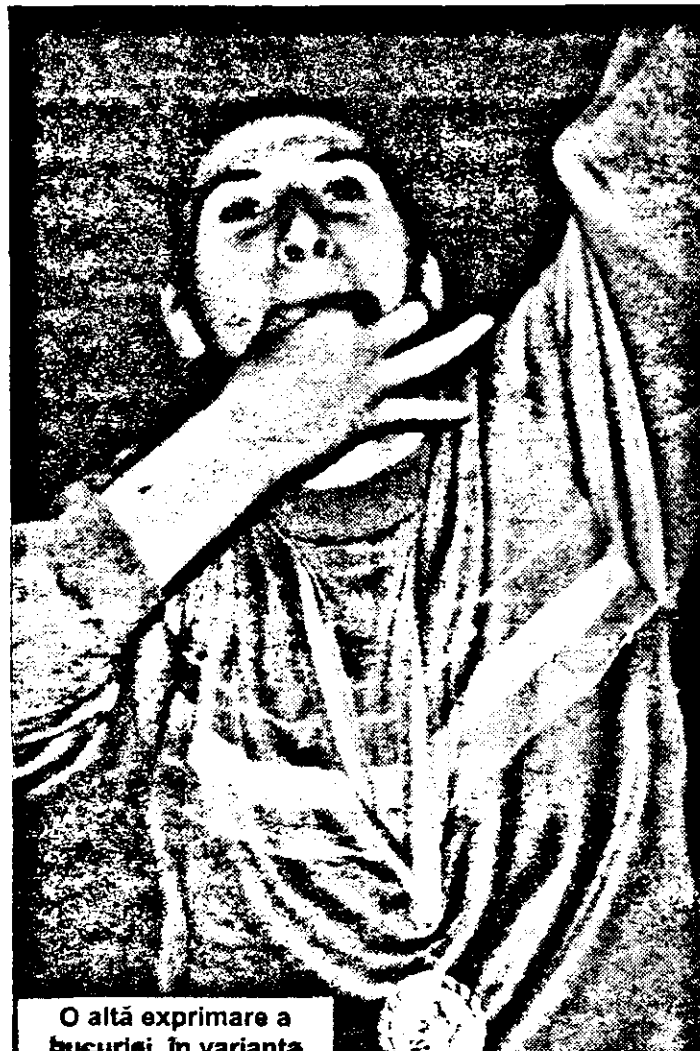
O altă exprimare a bucuriei, în varianta Cristinuței...