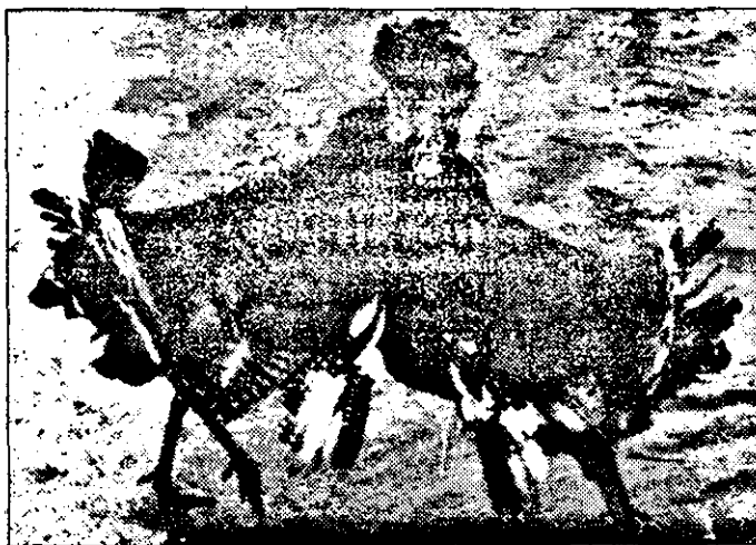
89.89. ... Șoapte fierbinti.