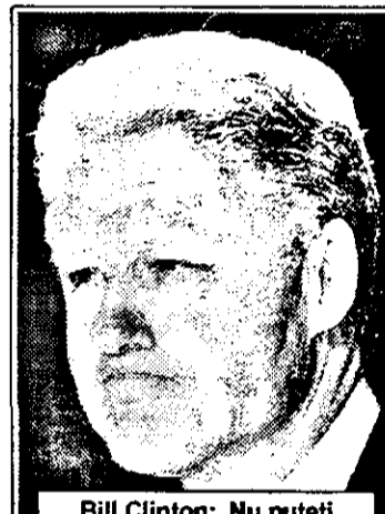
Bill Clinton: „Nu puteți vedea un asemenea tip de conflict, fără câteva erori.“

★ Moscova apreciază că operațiunea terestră este iminentă și va începe peste 7-10 zile ★ Boris Elțin amenință că Rusia nu va permite invadarea Iugoslaviei de către Statele Unite ★ Bombardamentele de până acum s-au soldat cu peste 1000 de morți, 17 poduri, 39 de uzine, 13 rafinării, 14 spitale și 150 de școli - distruse.