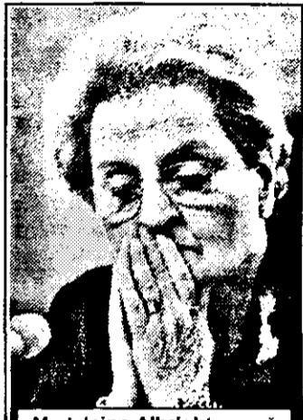
Madeleine Albright - pusă pe gânduri de „plerderle colaterale“ din Iugoslavia.

★ Moscova apreciază că operațiunea terestră este iminentă și va începe peste 7-10 zile ★ Boris Elțin amenință că Rusia nu va permite invadarea Iugoslaviei de către Statele Unite ★ Bombardamentele de până acum s-au soldat cu peste 1000 de morți, 17 poduri, 39 de uzine, 13 rafinării, 14 spitale și 150 de școli - distruse.