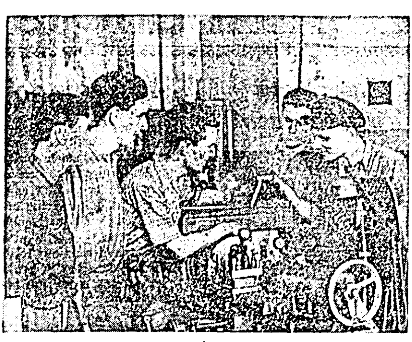
Brigada de tineret de la Centrul mecanic „Bernath Andrei” obține rezultate tot mai bune în producție. Planul pe luna august, de pildă, și l-a realizat în proporție de 115 la sută.