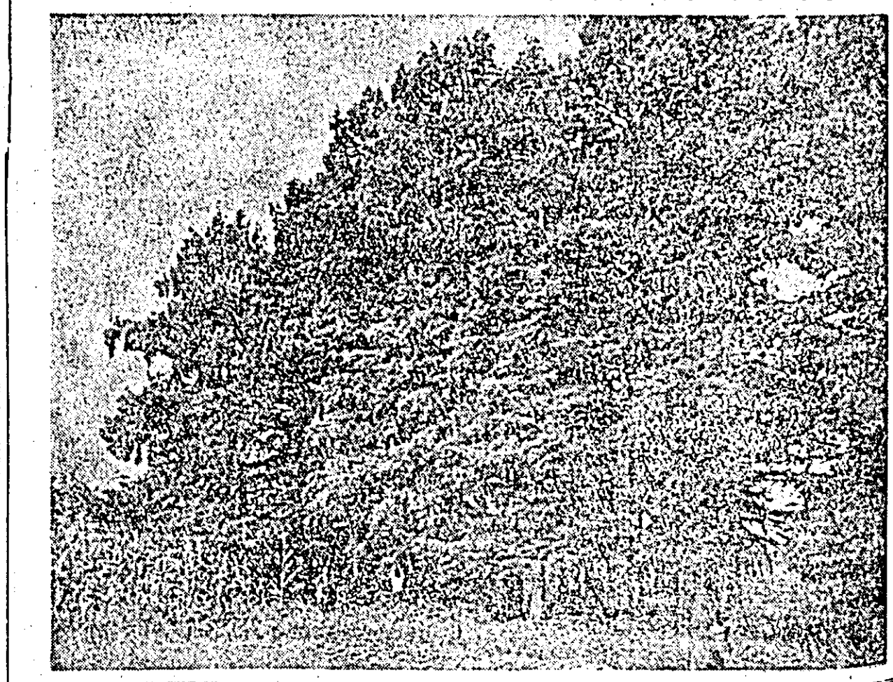
Chiparosi de baltă pe care-i vedeți în fotografia alături nu sînt altceva decît o specie de pînă din care se găsec puține exemplare în țara noastră. La GAS Utișniș se găsec aproape 60 din acești arbori, care se bucură de o înflorire deosebită. Sămînța lor reprezintă o mare importanță pentru înmulțirea acestui soi de conifere, care reprezintă adevărate monumente ale naturii.

năruțel ar costa mai mult decît leata țistora, a răspuns domnul Lissi, arătînd spre copiii care furnicau în galerie. Viața copiilor nu prețuiește doi bani în ochii patronilor. Copiii sârmani sînt cu mîile în Italia. Și nu costă nimic. Cu calii e altceva. Căci înseamnă „capital”. Și dacă mor, administrația minei preferă să lucreze cu copii. Munca a-cestora e foarte letină... lar